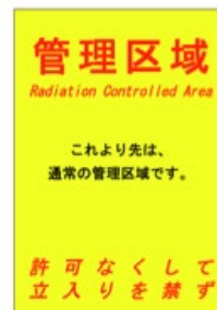
図 3: 注意表示

上記、【特例区域に立入る前に行う安全教育】の事項についてよく理解し遵守して作業します。