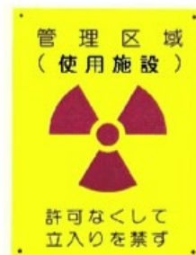
図 2: 管理区域 (使用施設) 標識